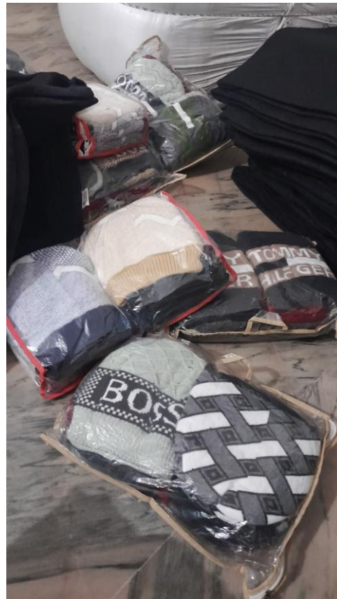
180 dekens en 180 mutsen